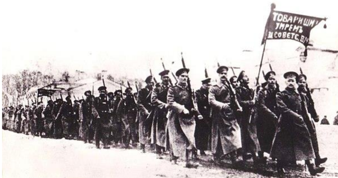
Отряд красногвардейцев. Псков. февраль 1918 года

Эти первые победы и стали «днем рождения Красной Армии».