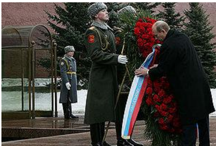
День защитника Отечества, Москва, Александровский сад , 23 февраля 2008 года. Президент России Владимир Путин возлагает венок к Могиле Неизвестного солдата .

Вместе с Россией сегодняшний праздник традиционно отмечают в Беларуси и Кыргызстане.